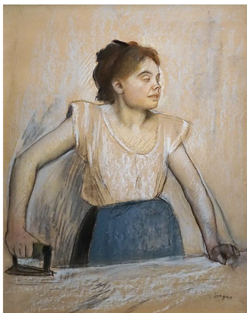
Edgar Degas, La repasseuse , v. 1869, Paris, Musée d'Orsay